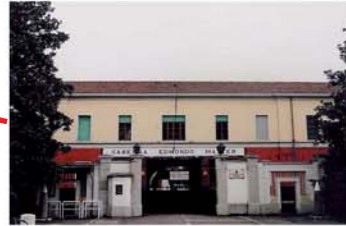
VENEZIA - MESTRE Caserma Matter (Esercito) VENEZIA - MESTRE Matter Barracks (Army)