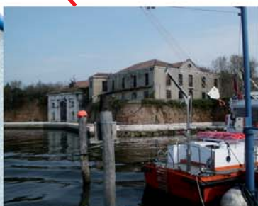
CHIOGGIA Forte San Felice (Marina) CHIOGGIA Forth San Felice (Navy)