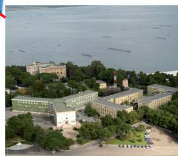
TARANTO Scuola Volontari (Aeronautica) TARANTO Troops Training Facility (Air Force)