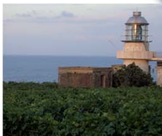
MESSINA Faro Capo Faro (Marina) MESSINA Cape Faro Lighthouse (Navy)