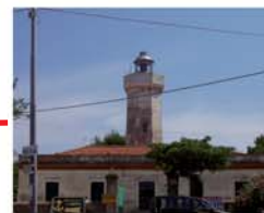
CROTONE Faro Capo Rizzuto (Marina) CROTONE Cape Rizzuto Lighthouse (Navy)