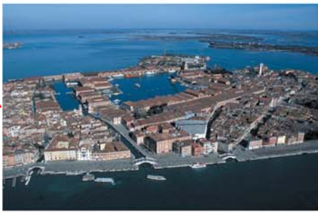
VENEZIA Frazioni Immobiliari Arsenale di Venezia (Marina) VENEZIA Arsenale di Venezia Real Estate Portions (Navy)