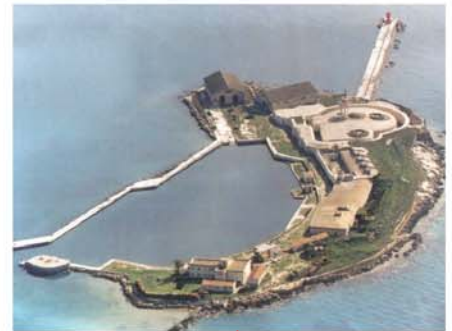
TARANTO Isola di San Paolo (Marina) TARANTO San Paul Island (Navy)