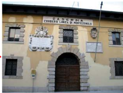
PALMANOVA Caserma Montezemolo (Esercito) PALMANOVA Montezemolo Barracks (Army)