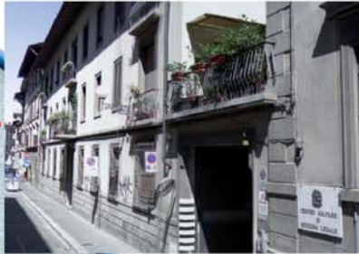
FIRENZE Comprensorio San Gallo (Esercito) FIRENZE San Gallo District (Army)