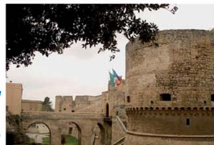
BRINDISI Castello Svevo (Marina) BRINDISI Swabian Castle (Navy)