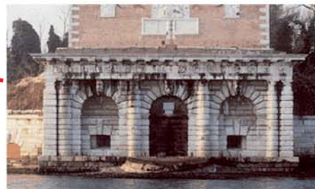
VENEZIA ex Idroscalo Sant'Andrea (Esercito) VENEZIA ex Seaplane Base Sant'Andrea (Army)