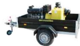
Motopompa autoadescante per grandi portate su carrello omologato per traino veloce stradale

Ponte di Piave / Tv - Italy - Via delle Industrie, 20 - Tel. 0422.853200 - Fax 0422.853461 www.euromacchine.it - info@euromacchine.it