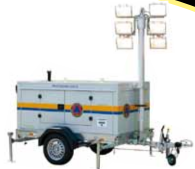
Unità di illuminazione mobile su carrello omologato per traino veloce stradale