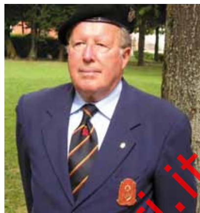
Lag. Gen. Giampaolo Saltini

l'impressione di un'Associazione divisa e rancorosa. E' successo che alcuni Presidenti di Sezione o Lagunari, abbiano ritenuto di risolvere talune diatribe, a livello quasi personale, estendendo la diffusione a tutte le altre Sezioni che, non conoscendo i motivi del contendere, potevano solo rimanere perplesse, e immaginare chissà quali problematiche. Mi auguro che questa strana abitudine sia del tutto eliminata. Se vi sono controversie fra Sezioni o Presidenti o Lagunari, devono essere affrontate e risolte con leali e sereni confronti diretti, magari attorno ad un tavolo imbandito, senza mai dimenticare che lo spirito che ci deve animare, e che ci anima, è l'amore per la Specialità, l'orgoglio per il Leone di San Marco che portiamo sul e nel cuore. Chiediamoci sempre se quel-