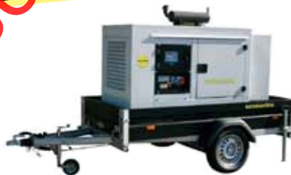
Gruppi elettrogeni con carrello omologato per traino veloce stradale