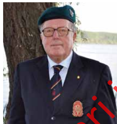
Lag. Gen. Giampaolo Saltini

programmazione delle attività, nel sostegno alle Sezioni, nella